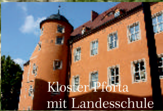
Kloster Pforta mit Landesschule