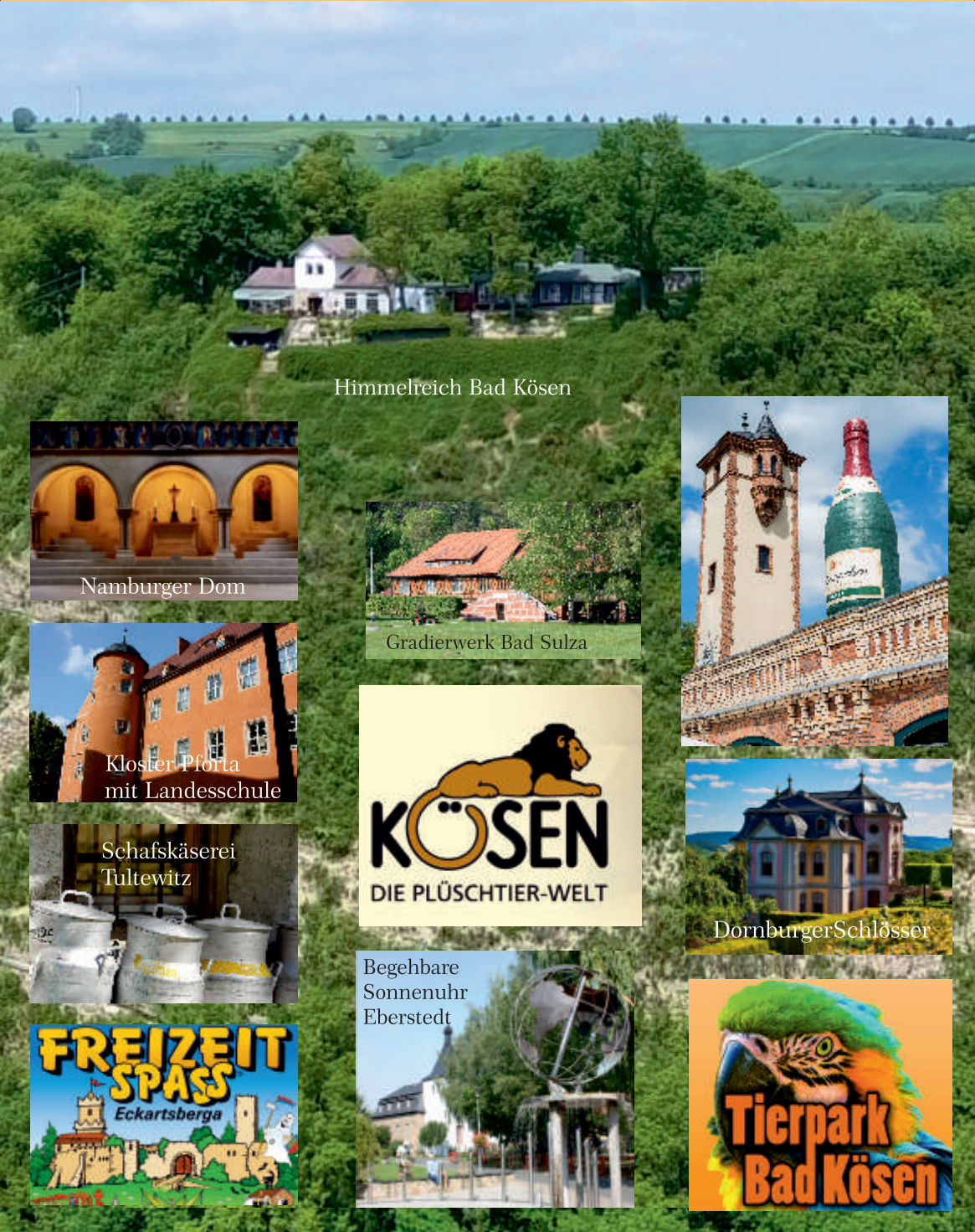
Himmelreich Bad Kösen