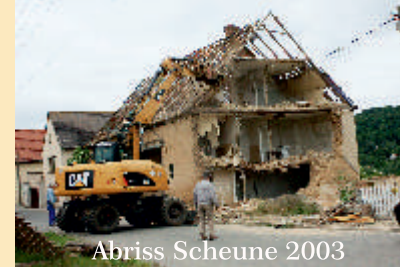
Abriss Scheune 2003