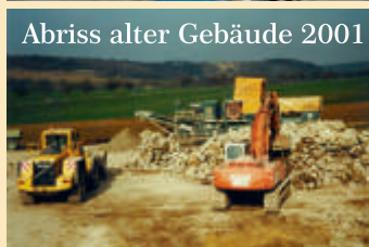
Abriss alter Gebäude 2001