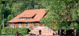
Gradierwerk Bad Sulza