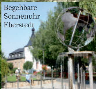
Begehbare Sonnenuhr Eberstedt