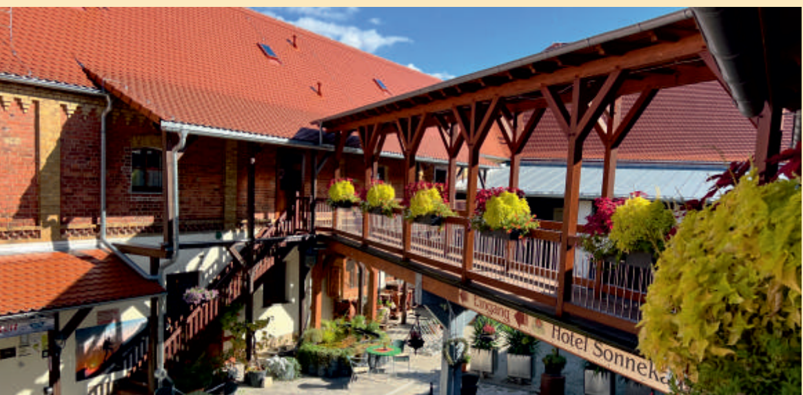
Mit Biergarten -- direkt am Radweg

helfen Ihre wertvolle Urlaubszeit noch besser gestalten zu können. Mit Freizeit- und Sportmöglichkeiten, interessanten Neuigkeiten, Veranstaltungen, und natürlich attraktiven Buchungsangeboten im Paket. Egal wie Sie sich hier auch fortbewegen möchten als Wanderer/in oder Radfahrer/in auf den Radwegen an Ilm und Saale, welche direkt an unseren Haus vorbei laufen oder per Bahn, Bus oder PKW. Wir helfen Ihnen gern bei der Planung Ihres Ausfluges. Sprechen Sie uns an. Genießen Sie regionale Produkte und Entdecken Sie die Vielfalt des Saale - Unstrut-Weines in seinen verschiedenen Facetten. Die unterschiedlichen Lagen und Böden machen ihn zu einem einzigartigem Genuss.